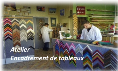
Atelier Encadrement de tableaux

Les jeunes se familiarisent avec le monde professionnel ou se remobilisent dans leur scolarité. Ils abordent la notion de la valeur travail tant au sein des ateliers/ classe et UES que lors de stages de découverte ou d'orientation professionnelle.